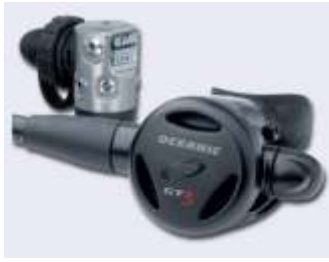
1.: Oceanic Automatenset

Unser "Schmankerl" ist diesmal das Automatenset von Oceanic.