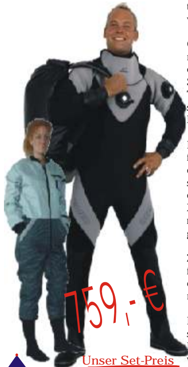
2.: Oceanic COMFODRY

Der Oceanic COMFODRY ist ein extrem bequemer Trockentauch-Anzug vom Feinsten.